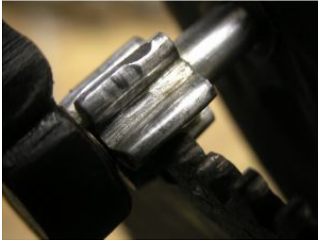
zu tiefer Eingriff - Beschädigung des Triebes