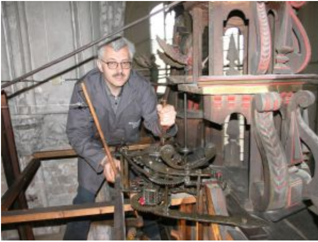
Werk des Apostelumganges ...