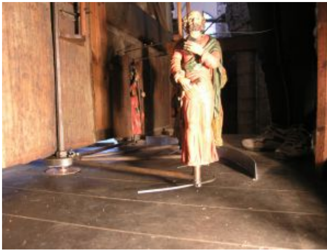
Apostelfigur auf dem Drehgestell