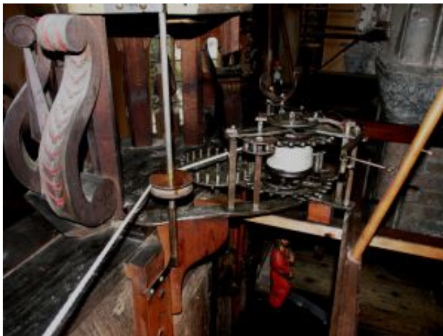
Werk nach der Restaurierung •