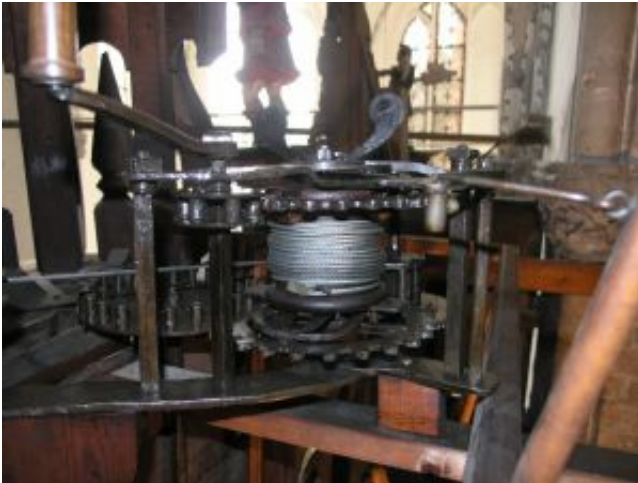
... vor der Restaurierung